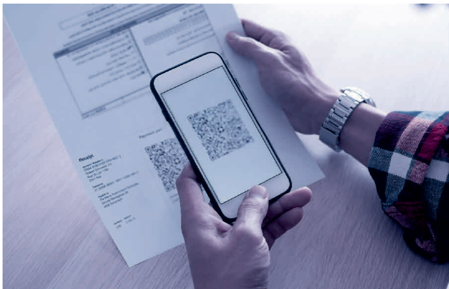
Scannen und fertig: Der QR-Code enthält alle relevanten Rechnungsdaten.

Lesen Sie mehr zum Thema im Blogbeitrag von TREUHAND|SUISSE unter www.treuhandswiss.ch/blog